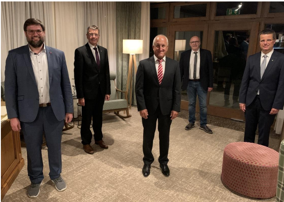
Verabschiedung stellvertretendes Vorstandsmitglied